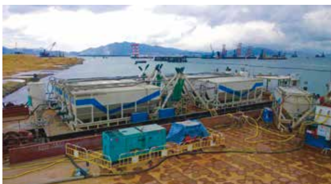
9. I silo di cemento e mixing plant sulla chiatta