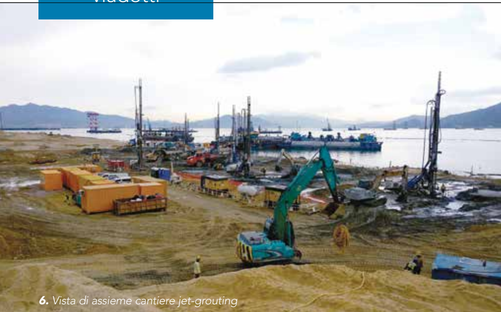
6. Vista di assieme cantiere jet-grouting