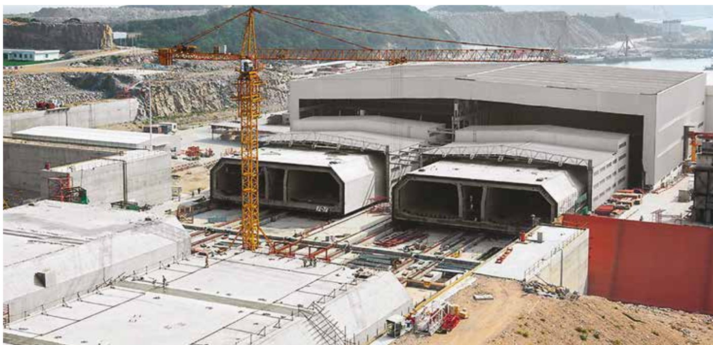
11. La costruzione dei grandi elementi in calcestruzzo per il tunnel sottomarino con tecnologie di casseforme Peri

(1) General Manager di Trevi Construction Hong Kong