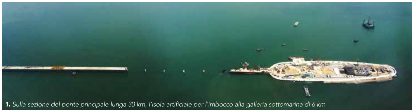
1. Sulla sezione del ponte principale lunga 30 km, l'isola artificiale per l'imbocco alla galleria sottomarina di 6 km