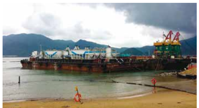
10. Un dettaglio della chiatta