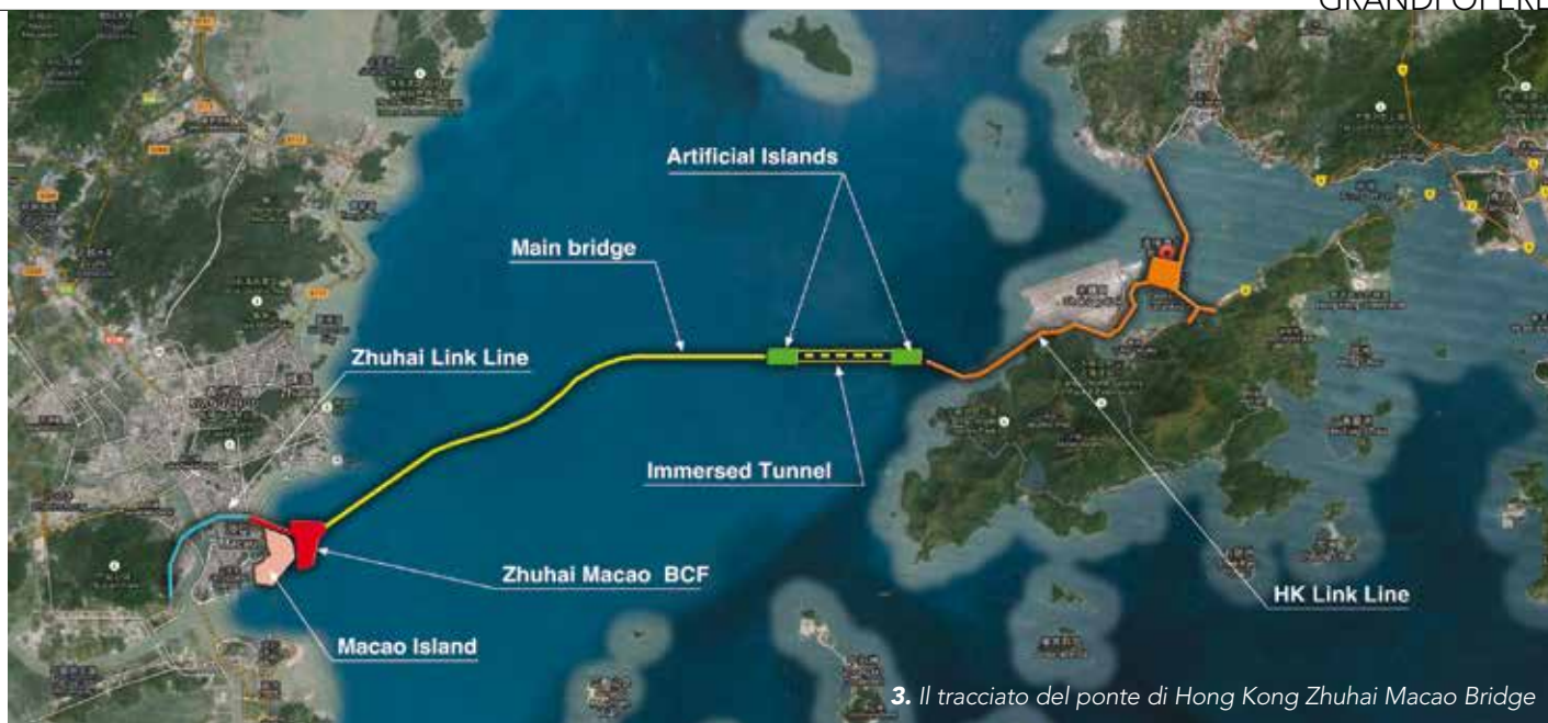
3. Il tracciato del ponte di Hong Kong Zhuhai Macao Bridge