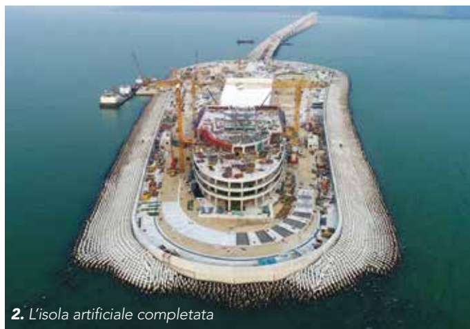
2. L'isola artificiale completata

Il progetto Fixed Link Hong Kong-Zhuhai-Macao (HZMB) prevede un collegamento fisso tra i due centri economici Hong Kong e Macao (entrambi sono regioni amministrative speciali all'interno della Repubblica Popolare Cinese) e la terraferma della Cina a Zhuhai. L'intero collegamento, che misura circa 50 km di lunghezza, è stato diviso in più sezioni principali. La sezione del ponte principale dell'HZMB corre dal confine marino di Hong Kong all'Isola di frontiera (Boundary Crossing Facilities, BCF) per la costa di Macau/Zhuhai.