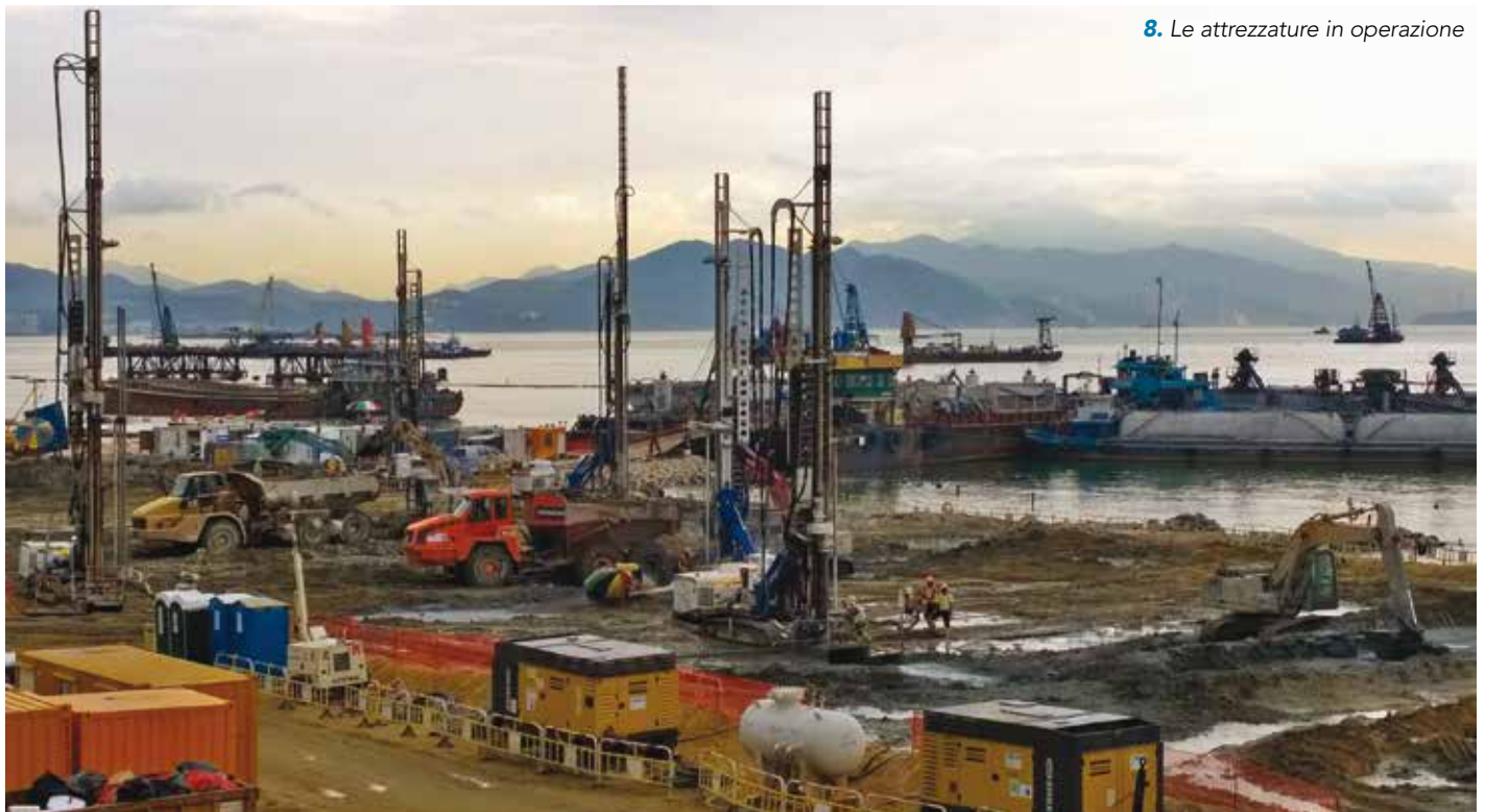
8. Le attrezzature in operazione