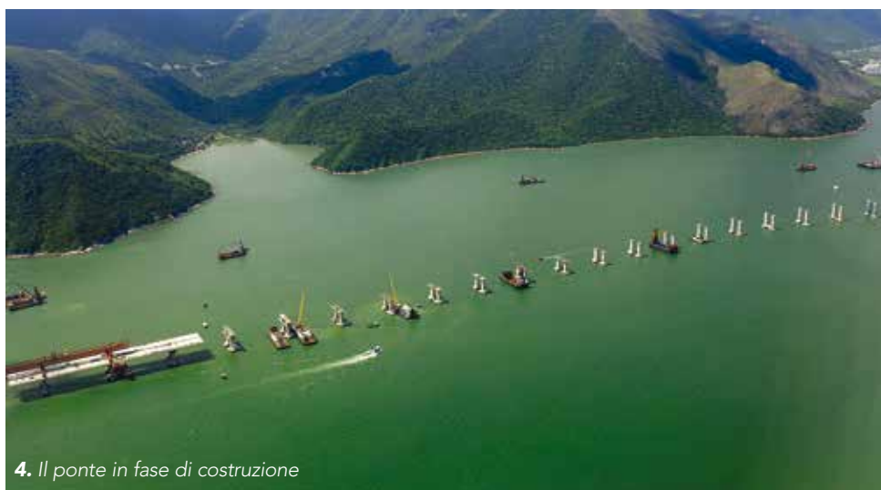
4. Il ponte in fase di costruzione