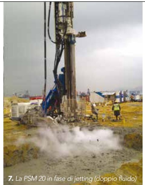
7. La PSM 20 in fase di jetting (doppio fluido)